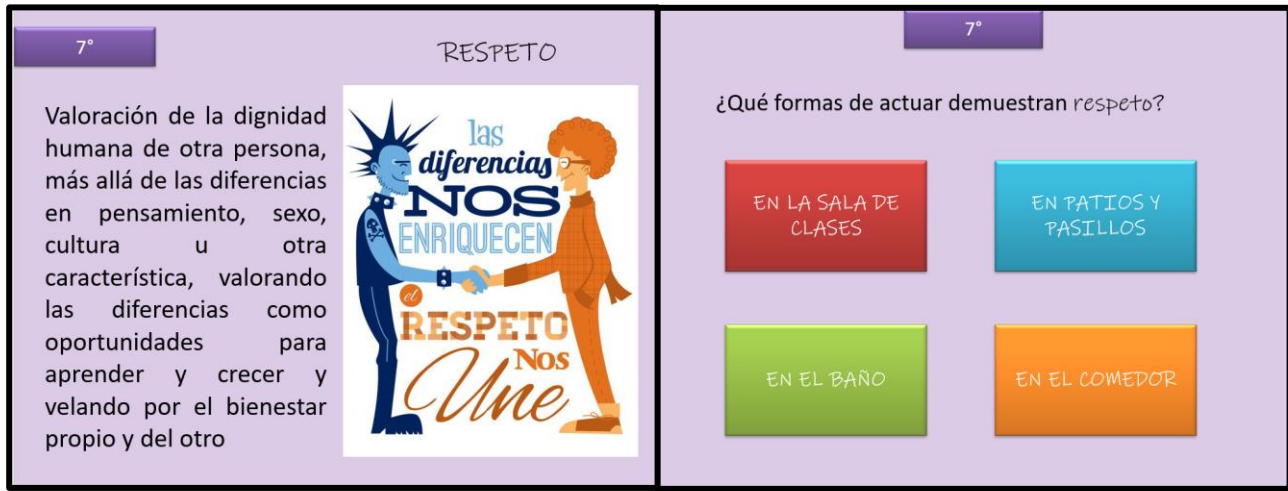
Imagen 5: Ejemplo material de trabajo grupal segundo ciclo básico.