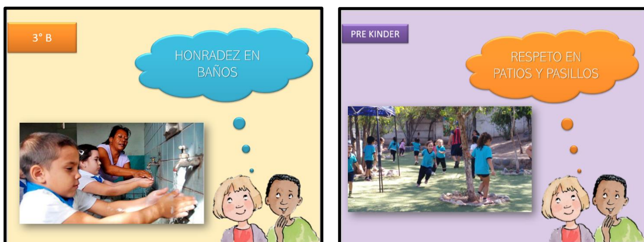
Imagen 3: Ejemplo de material visual de apoyo educación parvularia y primer ciclo básico.

En el caso de los y las estudiantes de segundo ciclo básico y enseñanza media , el trabajo es escrito por los mismos estudiantes, quienes se disponen en grupos de 4 a 7 personas.