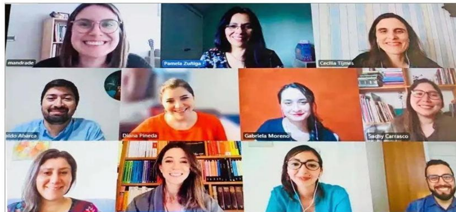
En la imagen, parte del equipo detrás de Convive en la Escuela, entre los que hay psicólogos educacionales, pedagogos, sociólogos y trabajadores sociales. Por participar en esta iniciativa, creada gracias a una alianza entre Fundación Paz Ciudadana, Ministerio de Educación y Educarchile, cada grupo escolar recibe retroalimentación constante, la que se va adecuando según las necesidades propias del establecimiento.